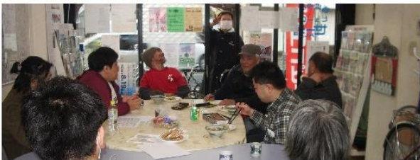
世一緒NOW 職場参加ビューロー世一緒ネット通信 3号 2017/2/24 〒343-0023 越谷市東越谷1-1-7 須賀ビル 世一緒内 048-964-1819 (TEL&FAX) shokuba@deluxe.ocn.ne.jp

さて、4月からの世一緒は、いろいろと楽しく役に立つプログラムをスタートさせます。次のページで、簡単にご紹介しましょう。あなたも参加したいと思ったら、電話してください。