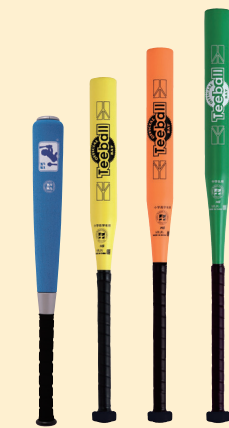
JTA-KTB-YS JTA-KTB-S JTA-KTB-M JTA-KTB-L

JTAケンコーティーボールバット SG-M(JTA-KTB-M) 1本 8,085円(税込) 重量:約550g 長さ:約75cm・φ:約57mm(打球部) 材質:表面/ポリウレタン・芯/アルミ合金・グリップテープ/ポリウレタン 色:オレンジ 中国製