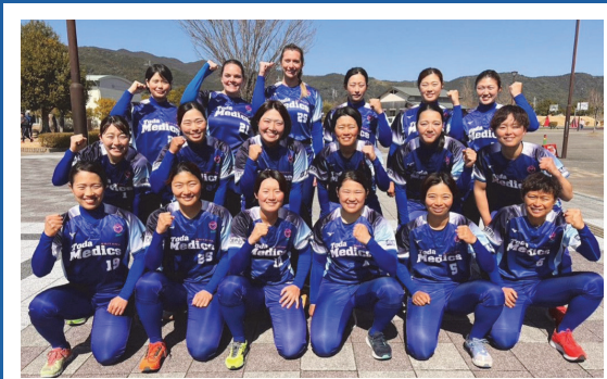
戸田中央メディックス埼玉

戸田中央総合病院は、昭和37年の開設以来「愛し愛される病院」の理念のもと医療サービスを提供してまいりました。これからも地域の方々をはじめとする皆さまの幅広い医療ニーズに対応すべく努力してまいります。