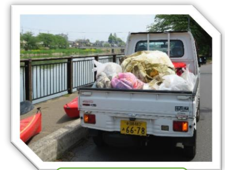
匠大塚裏ゴミ運搬