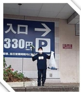
匠大塚駐車場入り口