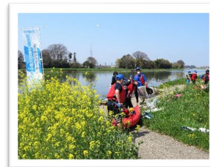
春日部市カヌー協会