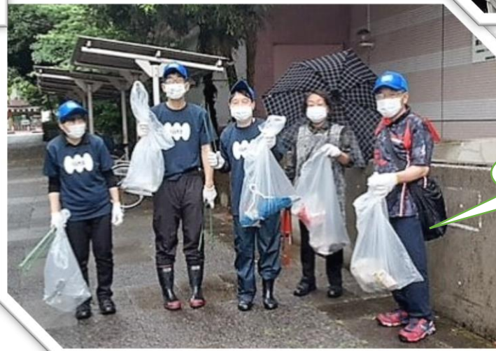
いっぱい拾ったね!