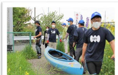
トラックからカヌーを川へ