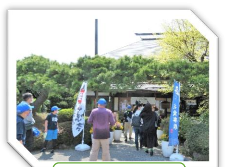
味亭天下一うどん