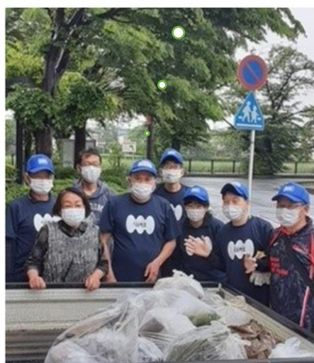
軽トラックへ積み込まれたゴミ