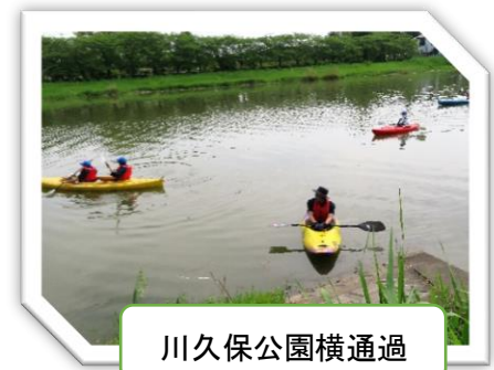
川久保公園横通過