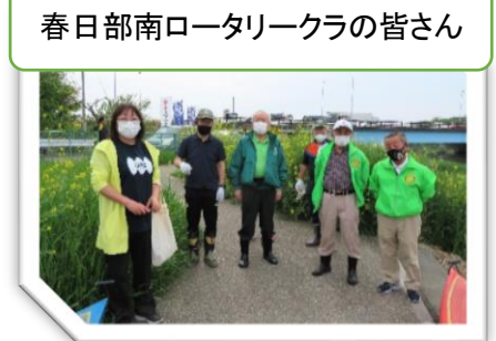
春日部南ロータリークラブの皆さん