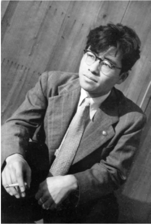
広島に帰省して（1956年）