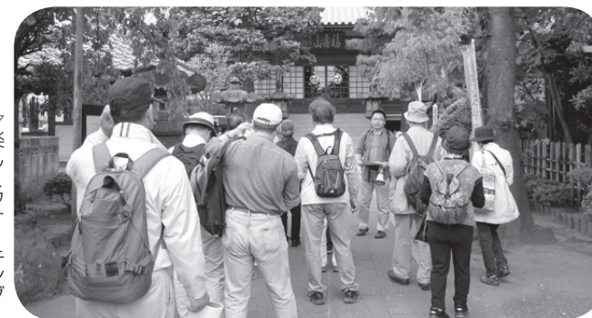
▽楽しくウォーキング