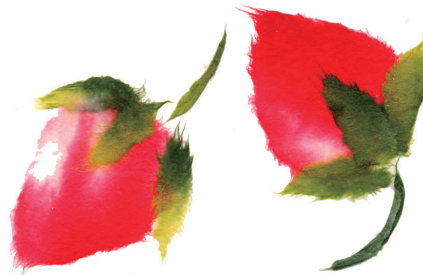
ちぎり絵・いちご