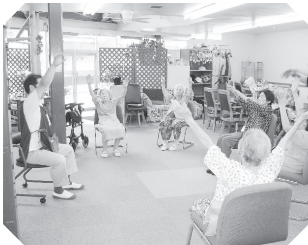
▽デイサービス・まあち